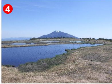
4 池塘の先には山頂に雪形を残した燧ヶ岳を望めます。