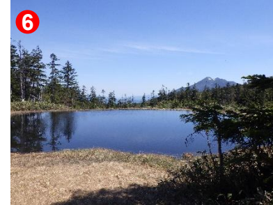
6 静かな池塘のほとりで、燧ヶ岳を眺めながらゆっくり休憩を。