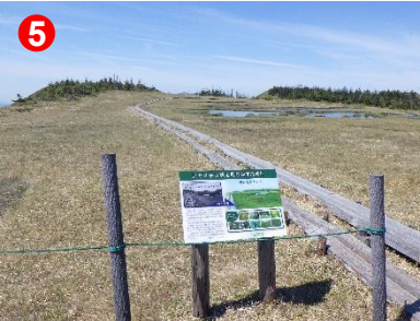
5 ベンチ脇に解説看板が設置され、植生保護の歴史を学べます。