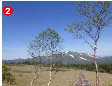
2 並んだシラカバの間から至仏山と遠く新潟方面の山々も望めました。