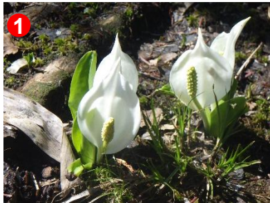
1 森を抜けると、咲き始めの真っ白なミズバショウが見られます。