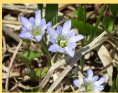
タテヤマリンドウ