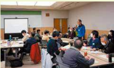
令和6年度活動報告