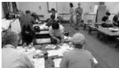
講義・フリップ資料の作成