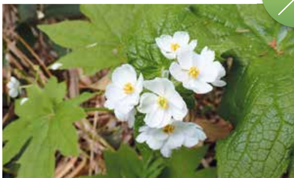
展望テラス付近に咲くサンカヨウは満開です