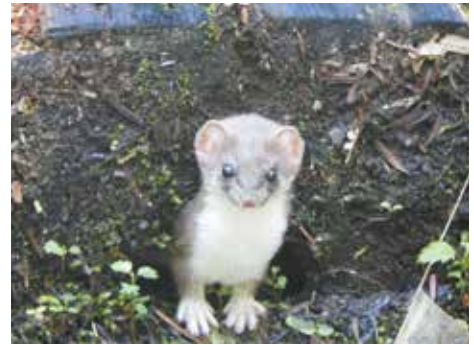
尾瀬の妖精との出会い 撮影日：2024/9/6 撮影場所：尾瀬沼山荘周辺

尾瀬の美しさに魅せられ、季節ごとに通うほか、防鹿柵のボランティアにも参加し、通算上山は165回を超えました。写真は、防鹿柵の効果で植生回復傾向にある大江湿原のニッコウキスゲの美しさを伝えたく、撮影したものです。