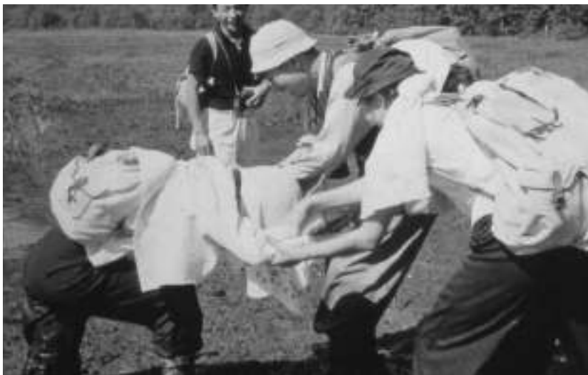
写真1 1952（昭和27）年8月 湿原にはまった登山者