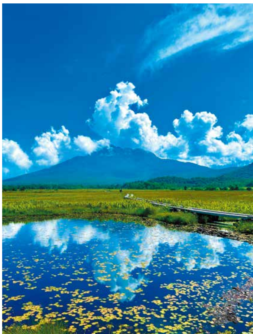
2024尾瀬Instagram投稿キャンペーン最優秀賞作品 「空と雲、そして燃ゆる緑の尾瀬」@junimexique