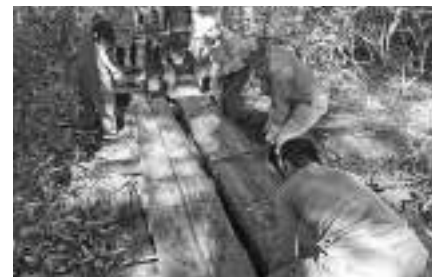
入れ替えを行う様子