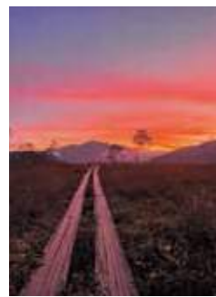
夕焼け空と原 撮影日：2024/9/30 撮影場所：竜宮十字路付近