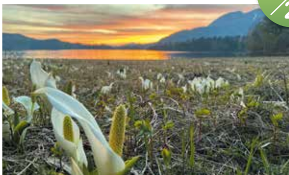
尾瀬沼周辺が青やピンクオレンジのグラデーションに包まれました