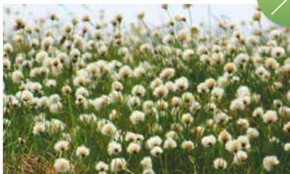
アヤメ平ではワタスゲの群生が見られました