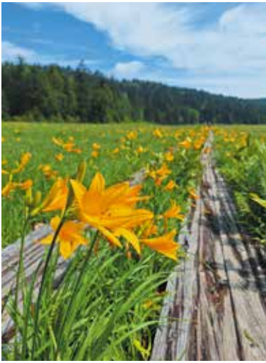
尾瀬、夏色に染まる 撮影日：2024/7/13 撮影場所：大江湿原