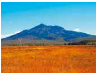
赤橙色の世界 撮影日：2024/10/13 撮影場所：牛首分岐と東電小屋の間