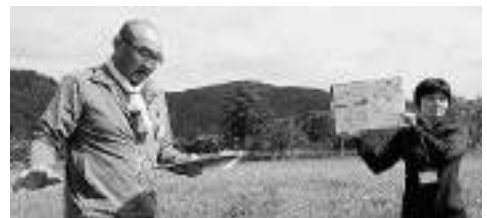
自然解説活動実習