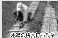
木道の柵木打ち作業