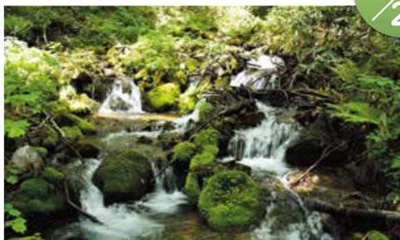
キリンテからの登山道は、美しい沢の流れを聞きながらの登山となります