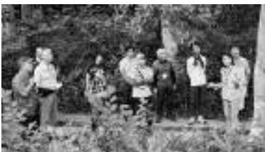
ガイドウォーク体験