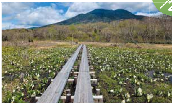
東電尾瀬橋付近のミズバショウの群生