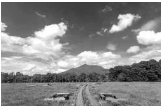
写真3 尾瀬ヶ原・竜宮