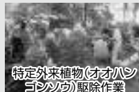
特定外来植物(オオハシゴシツウ)駆除作業