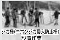
シカ柵(ニホンジカ侵入防止柵)設置作業