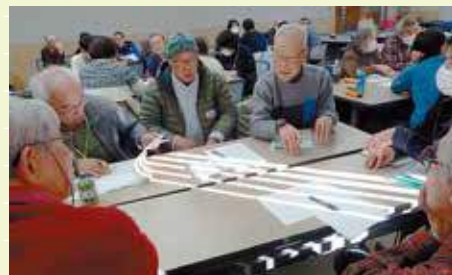
班別討議での議論

班別討議でいただいたご意見・ご提言を参考にし、さらに充実した尾瀬ボランティアの活動が展開できるよう、検討していきたいと思っております。ご参加いただいた皆様、ありがとうございました！