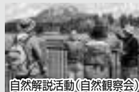
自然解説活動(自然観察会)