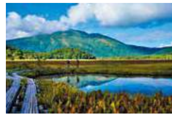
夏と秋の間 撮影日：2024/9/14 撮影場所：牛首分岐と竜宮十字路の間

静寂の中、朝霧が立ち込める尾瀬ヶ原。その彼方に浮かぶ朝焼けの燧ヶ岳。刻々と移りゆくその姿は、いつまでも眺めていたくなる美しい景色でした。