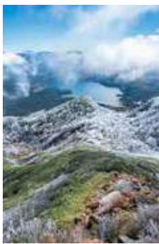
晩秋の尾瀬 撮影日：2024/10/20 撮影場所：燧ヶ岳（姫岳）