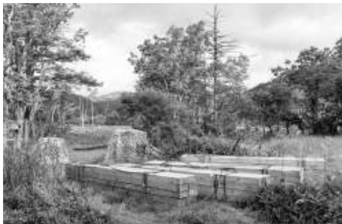
写真4 ヘリコプター輸送された木道資材