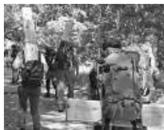
資材や道具を運ぶ様子

まずは、岩清水の水場整備から。岩清水の排水路であるが、木柵の下が朽ちており、水が漏れ出してしまっていた。ここは休憩する人が多いポイントでもあり、水漏れを抑えたかった。もともとの排水路は土台として残り、一度石を全て取り出して整地。木材を使ってU字溝のようなものを作成し、内側に重ねた。最後にゴムシートを敷き、石を戻して仕上げた。