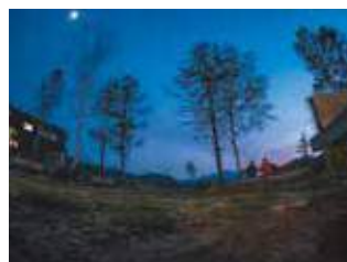
月に照らされて尾瀬 撮影日：2024/5/18 撮影場所：弥四郎小屋前

尾瀬沼に白鳥がやってきていた10月後半、暖かな陽光が湿原や山を照らし、色味あふれる秋の尾瀬の美しさに息を呑みました。そして、樹木の落葉も進むなか、三本カラマツが色づき始め、冬に近づく尾瀬を感じ、撮影しました。