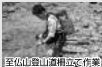
至仏山登山道柵立て作業