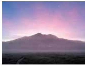
朝焼けの燧ヶ岳 撮影日：2024/8/1 撮影場所：見晴