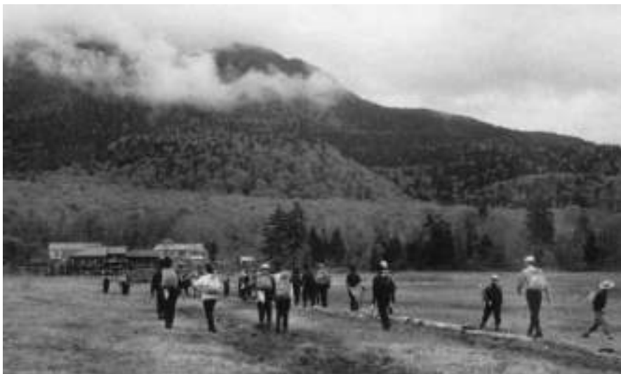
写真2 1960(昭和35)年6月 尾瀬ヶ原・見晴

に湿原を歩いている人が多いことが分かります。その理由としては、単線の木道ですれ違いが難しかった、また現在のよう に木道の上を歩くという意識や重要性が十分に定着していなかったことが考えられます。写真2中央下にある黒くなつた湿原は、登山者に何度も踏まれたことで湿原が壊れてしまった場所です。木道を歩くことが定着した現在では、こうした場所は見られなくなっています。