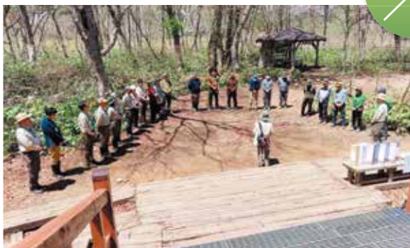
登山者や尾瀬に関わる皆様の安全を祈念しました。