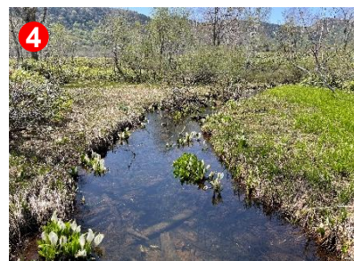
4 堀沿いのミズバショウが瑞々しく咲 いています。