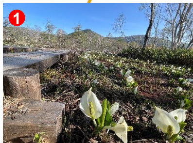
1 尾瀬ヶ原の入り口付近でふわっと ミズバショウの香りが広がります。