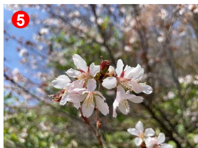
5 ミネザクラの優しいピンク色が 尾瀬に彩りを加えます。