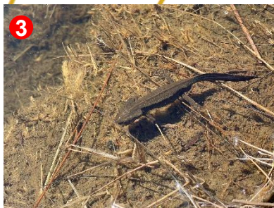
3 アカハライモリが気持ちよさそうに 泳いでいました。