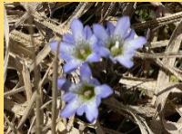
タテヤマリンドウ