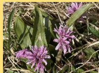
ショジョウバカマ