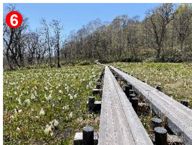
6 草木の芽吹いた緑とミズバショウの 白が美しく一面に広がっています。