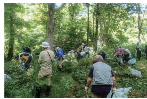
オオハシソウワケ除去作業