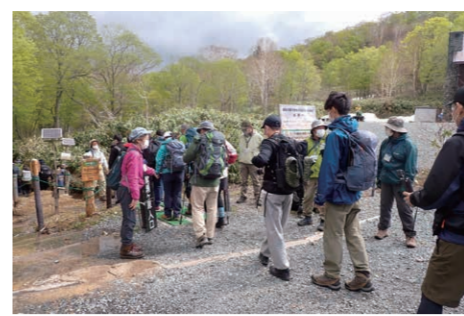
尾瀬ボランティアによる入山口啓発活動

尾瀬保護財団は、尾瀬国立公園をフィールドとして「尾瀬での体験と感動を、自然を守る力に変える」をミッションに掲げて活動する公益財団法人です。平成7年の設立以来、関係機関と連携しながら、入山者へのマナー啓発、ビジターセンターの管理運営、ボランティアの育成支援、野生動物対策、外来植物対策、尾瀬総合学術調査の事務局運営など、主にソフト面から尾瀬の保護と適正利用を促すための活動に取り組んでいます。