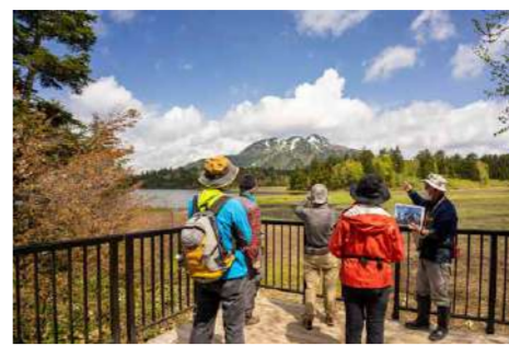
ビジターセンター職員による自然観察会