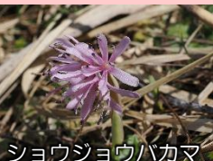
ショウジョウハカマ