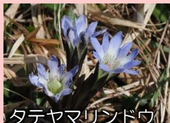
タテヤマリンドウ