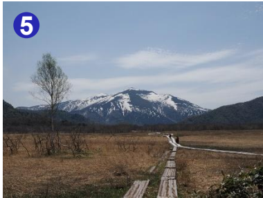
見晴からは、広大な尾瀬ヶ原と西にそびえる至仏山の雄姿が望めます。