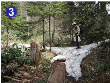
白砂峠の残雪は東側斜面に集中しています。西側は段小屋坂まで雪がありません。