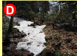
段小屋坂は残雪が多く、踏み抜きにご注意ください。