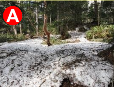
林内に残雪が多く残っています。スリップ注意です。