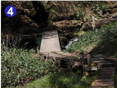
イヨドマリ沢の豊かな流れに心癒されながら歩を進めましょう。