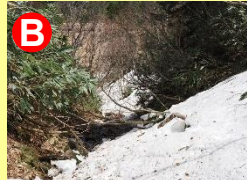
白砂峠の東斜面は滑落・踏み抜き・傾木にご注意を。