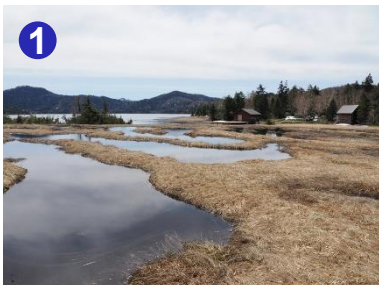
沼尻に美しい池塘があります。公衆トイレは5/23から利用可能です。(休憩所は開始日未定)