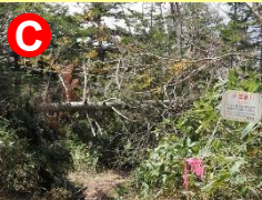
頭上のかかり木に注意して速やかに通過しましょう。