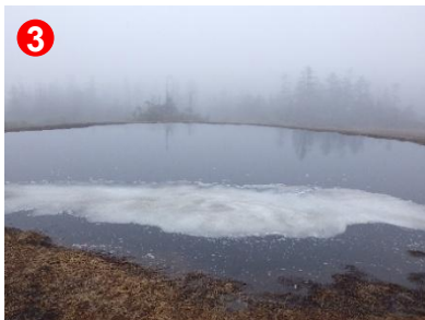
3 池塘に霧がかかり、幻想的な風景でした。