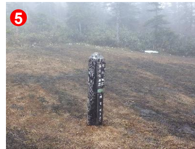
5 木陰にミズバショウ、足元にショウジョウバカマが咲いていました。