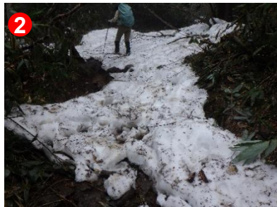
2 残雪が残っていますので、踏み抜き、道迷いにご注意ください。