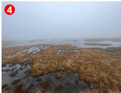
4 霧が濃く、残念ながら眺望は得られませんでした。