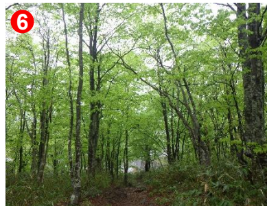
6 ブナの新緑が瑞々しく、地面にはブナの花が落ちていました。