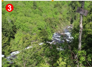
3 平滑ノ滝です。一枚岩の上を雪解け水が滑らかに流れています。