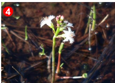
4 ヨッピー吊橋手前にある池塘では、ミツガシワが咲き始めていました。