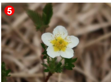
5 竜宮十字路のベンチ脇にチングルマが咲いていました。