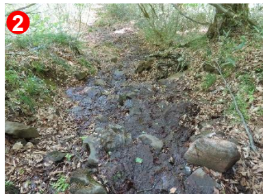
2 平滑ノ滝～三條ノ滝間はぬかるみに注意してください。