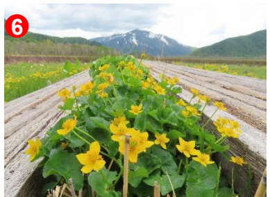
6 至仏山を背景にリュウキンカの黄色が映えます。