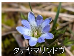
タテヤマリンドウ