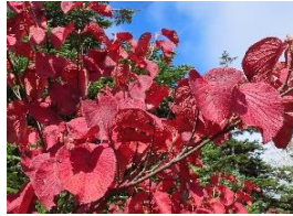
オオカメノキ(紅葉)