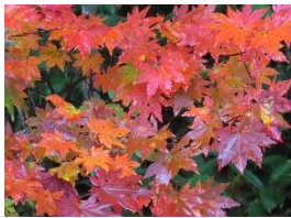
ハウチワカエデ(紅葉)