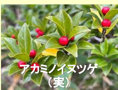
アカミノイヌツゲ (実)