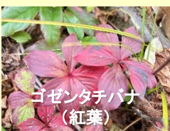
ゴゼンタチバナ (紅葉)