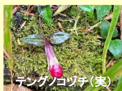
デンゲンノコヅチ(実)