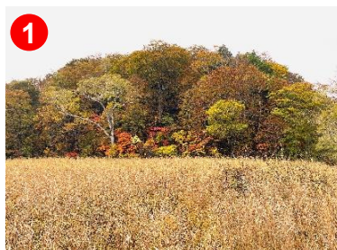
牛首と呼ばれる丘部分では樹木が紅葉し始めました。