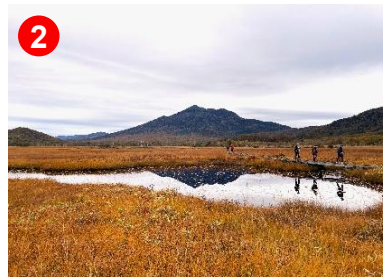
穏やかな池塘が美しい水鏡となり、燐ヶ岳と登山者を映していました。