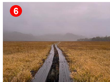
雨が降ると遠くがぼんやりと霞み、幻想的な空間となりました。