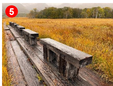
ここで尾瀬ヶ原の草もみじを360°見渡すことができます。