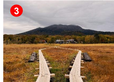
架け替え工事が終了し、木道が新しくなりました。