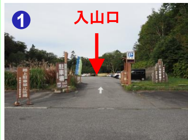
燧裏林道へは御池駐車場奥の御池登山口に入り、1分ほどで現れる分岐を直進します。