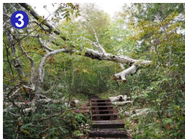
木道上空に枯れ木が渡っています。頭上に気をつけ立ち止まらず速やかに通り抜けましょう。