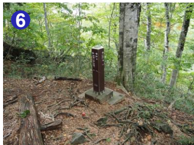
尾瀬ヶ原・三條ノ滝・御池、各方向の分岐点です。ご自身の進む方向をよく確認しましょう。