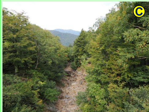
裏燧橋の上からの眺め。眼下はシボ沢、遠くは日本百名山の平ヶ岳です。