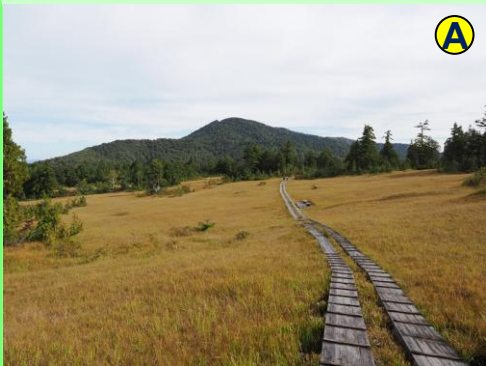
上田代では草紅葉の向こうに大杉岳を望めます。