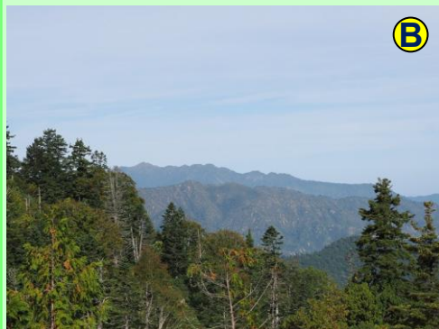
ノメリ田代からは、新潟方面の山々を望むことができます。