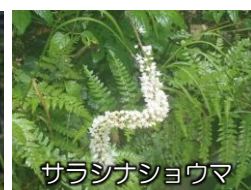
サラシナショウマ