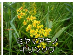
ミヤマアキノ キリンソウ