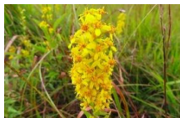
ミヤマアキノキリンソウ