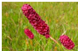
ミヤマワレモコウ