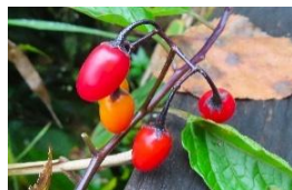
オオマルバナホロシ (実)