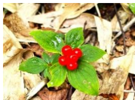
ゴゼンタチバナ (実)