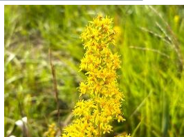
ミヤマアキノキリンソウ