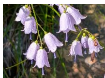
ツリガネニンジン