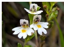
ホソバコゴメグサ