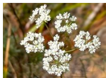
ミヤマウイキョウ