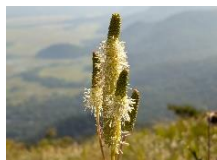
タカネトウウチソウ