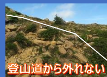
登山道から外れない