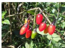
オオマルバノホロシ(実)