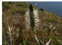
タカネトウチソウ