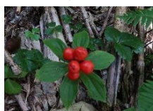
ゴゼンタチバナ(実)