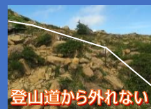
登山道から外れない