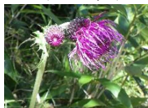
ジョウシュウオニアザミ