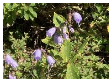
ツリガネニンジン