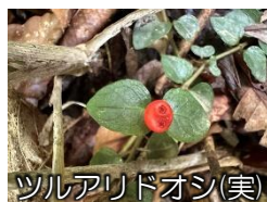
ツルアリドオシ(実)

大津岐峠には、御池方面、キリシテ方面を指し示す標識があります。進路を確認しましょう。