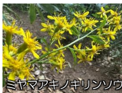
ミヤマアキノギリソウ