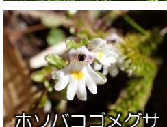
ホソバコゴメグサ