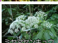
ミヤマセンキュウ