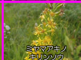
ミヤマアキノ キリンソウ