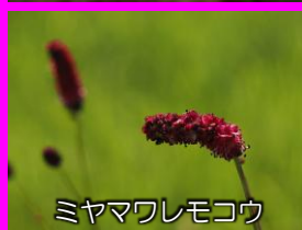
ミヤマワレモコウ