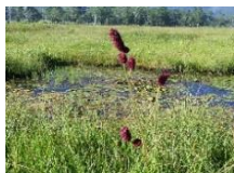
ミヤマワレモコウ