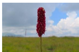
ミヤマワレモコウ