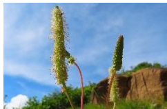
タカネトウウチソウ