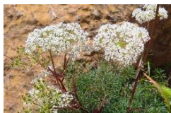
ミヤマウイキョウ