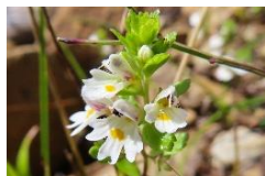
ホソバコゴメグサ