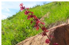
ムラサキタカネアオヤギソウ