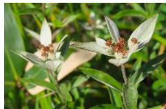
ミネウスユキソウ