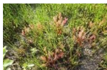
ナガバノモウセンゴケ