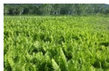
ヤマドリゼンマイ