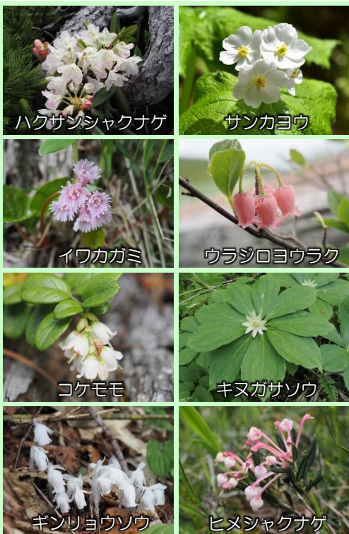
ハクサンシャクナゲ

【今日の尾瀬沼】 天気: 晴れのち曇り 最高気温: 24.7℃ 最低気温: 16.5℃ 日の出: 04時27分 日の入: 19時06分