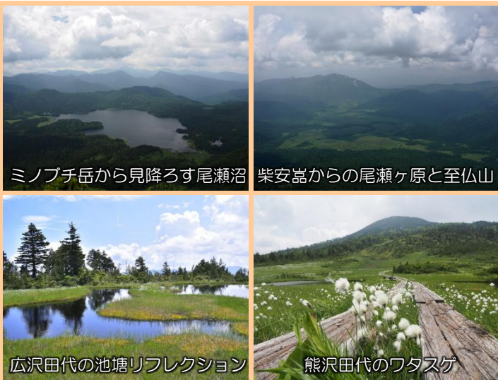
ミノブチ岳から見降ろす尾瀬沼