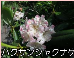
ハクサンジャクナゲ