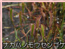
ナガバノモウセンゴケ