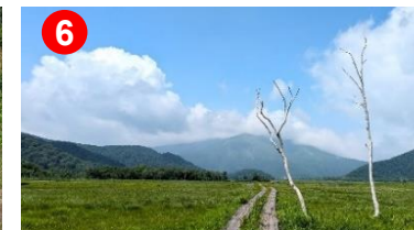
6 夏空へ手を伸ばすようなシラカバの立木がありました