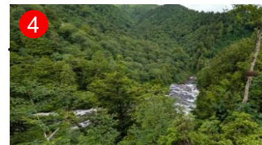
4 一枚岩の上を水がとうとうと流れています