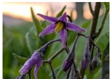
オオマルバノホロシ