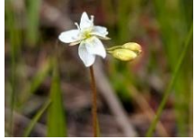
モウセンゴケの花