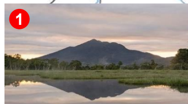
1 燧ヶ岳が池塘に映り鏡のようでした