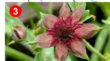
3 クロバナロウゲが咲いていました