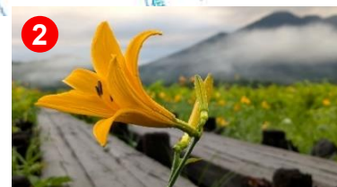
2 ニッコウキスゲの花が咲き始め、群生となっています