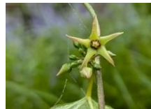
シロバナカモメヅル