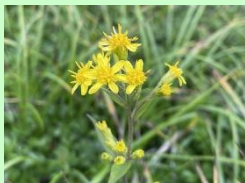
ミヤマアキノキリンソウ