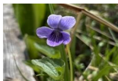
オオバタチツボスミレ