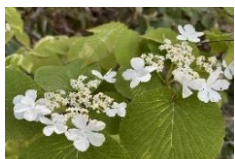
オオカメノキ（林内）