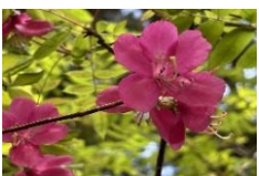
ムラサキヤシオ（林内）