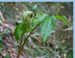
ヒロハテンナンショウ