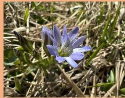
タテヤマリンドウ