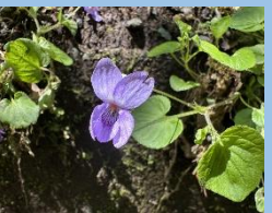
オオタチツボスマリ