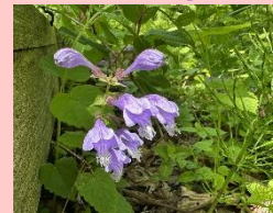
ラショウモンカズラ