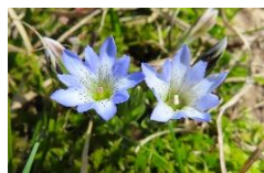
タテヤマリンドウ