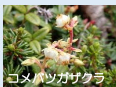
コメバツガザクラ