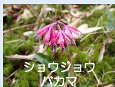
ショウジョウ バカマ