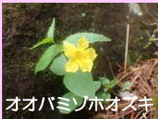
オオバミノホオスキ