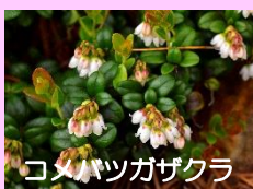
コメバツガザクラ