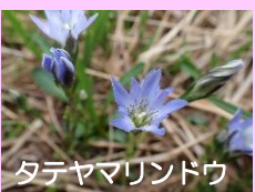
タテヤマリンドウ