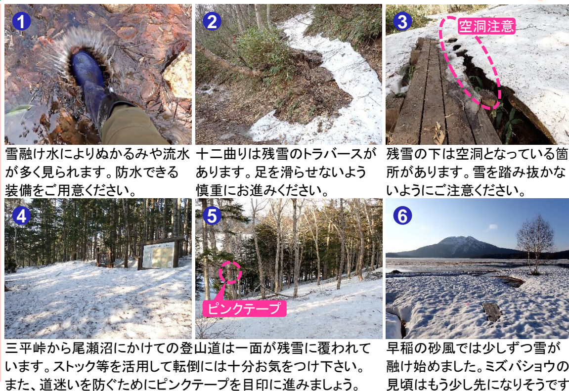
大清水湿原の様子

【今日の尾瀬沼】 天気：晴れ 最高気温：17.2℃ 最低気温：-1.1℃ 日の出：4時36分 日の入：18時43分