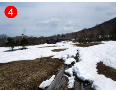
温泉小屋方面も雪解けが進んでいます。