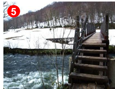
東電尾瀬橋から眺める只見川の雪解け流れが雄大です。