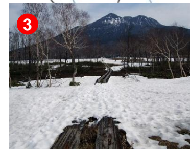
残雪箇所では踏み抜きにご注意ください。