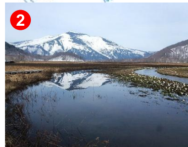
尾瀬の代表ビュースポット下ノ大堀川です。