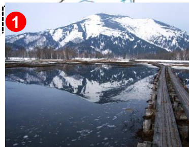
尾瀬湖と呼ばれることもある融雪水は鏡のようです。