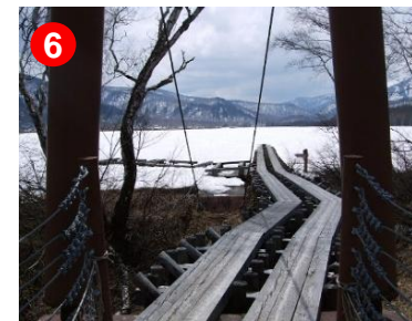
ヨッピー吊橋付近のベンチも姿を現し始めました。