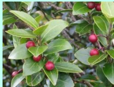
アカミノイヌツゲ(実)