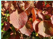
オオカメノキ(紅葉)