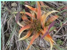
ネバリノギラン(紅葉)