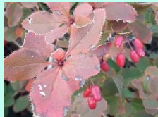
マルバヘビノボラズ(実)