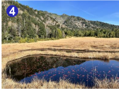
4 沼尻には池塘を巡るように木道が設置されています。ヒツジグサの紅葉をお楽しみください。