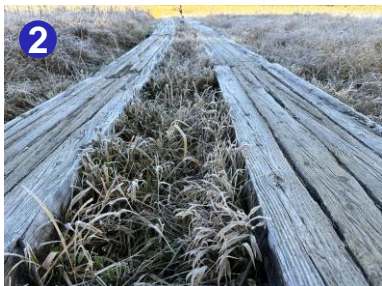
2 早朝の木道は霜や凍結により滑りやすくなっています。小股でゆっくり歩きましょう。