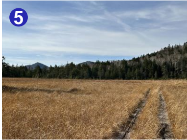
5 大清水を過ぎると、皿伏山、白尾山を経て、富士見峠へ至る登山道が続きます。