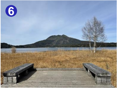
6 早稲の砂風にはベンチが設置されており、雄大な燧ヶ岳をのぞむことができます。