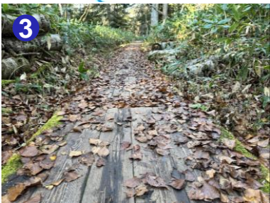
3 落葉に覆われた木道は滑りやすいので注意しましょう。雨で濡れている時は特に慎重に。