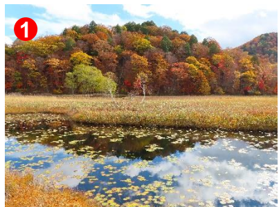
牛首付近の山の木々が、見事に色づいています。