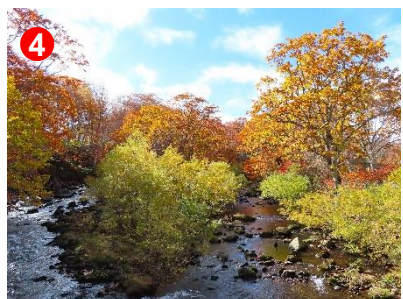
東電尾瀬橋周辺では、カエデ類などの紅葉が広がっています。