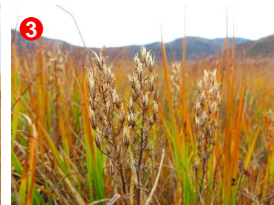
キンコウカの実が、草もみじに花を添えています。