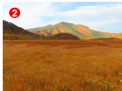
黄金色の草もみじの向こうに、色づいた至仏山が望めます。