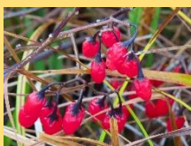
オオマルバノホロシ(実)