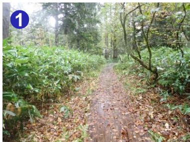
尾瀨沼北岸はよく整備された歩きやすい道が続きます。 濡れた木道や落葉に覆われた木道は非常に滑りやすいので 十分ご注意ください。