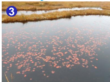
沼尻の池塘ではヒツジグサの 紅葉が見頃となっています。