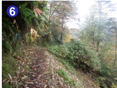
尾瀨沼南岸の登山道は細い箇所や高低差があります。足元にお気をつけください。