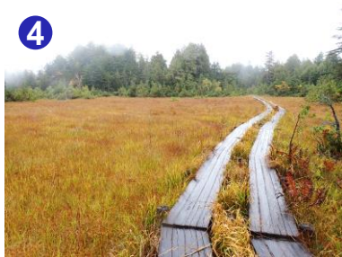
尾瀨沼周辺の湿原では草紅葉が見頃を迎えています。 また、ダケカンバ、ナナカマド、カエデ類など、木々の紅葉も 少しずつ進んでいます。