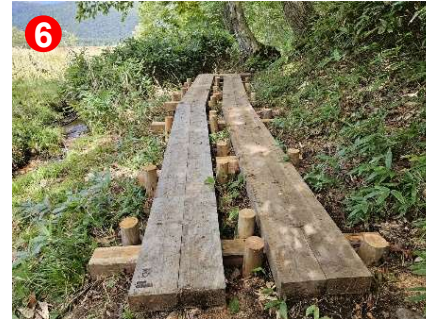
木道の更新工事が終わり歩きやすくなっています。