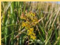
ミヤマアキノキリンソウ