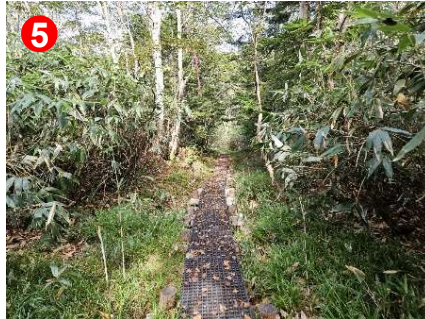
木道に滑り止めがついている場所が多く、歩きやすいです。