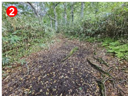
林内の登山道は一部ぬかるみがあります。