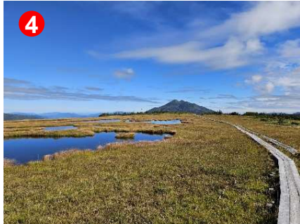
大きな池塘やベンチがあり、燧ヶ岳が望めます。