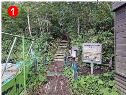
鳩待休憩所の裏側がアヤマメ平方面の登山口となります。