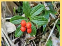
ゴゼンタチバナ(実)