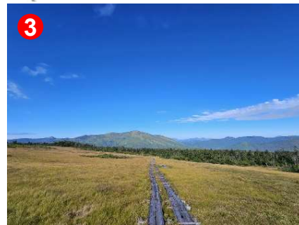
林内を抜けると360°の展望が開けます。