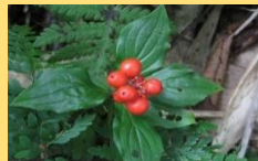
ゴゼンタチバナ(実)