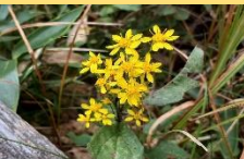
ミヤマアキノキリンソウ