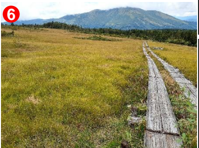
6 至仏山に向かっていくかのような道が続いています。