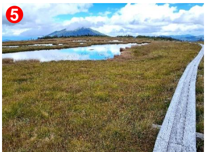
5 大きな池塘と草紅葉、遠くの山々の眺めを楽しめます。