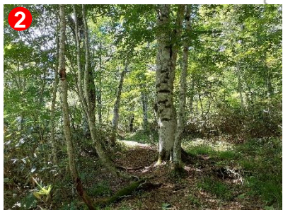
2 ブナやミズナラの大木が多く、傾斜のゆるやかな区間です。