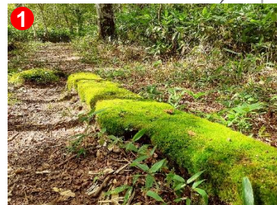
1 八木沢道には、鮮やかな緑色のコケで覆われた木や石が見られます。