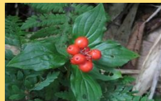
ゴゼンタチバナ(実)