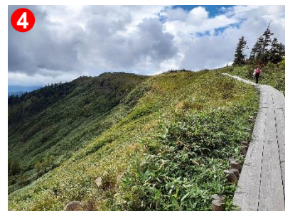
4 南側が大きく開け、台地上のアヤマメ平を見ることができます。