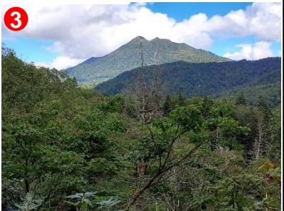
3 燧ヶ岳を望める場所が、ところどころにあります。