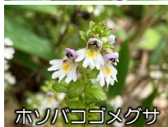
ホンバコゴメグサ