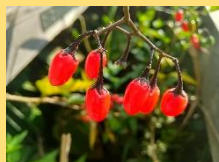
オオマルバナホロシ(実)