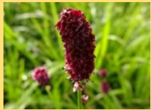
ミヤマワレモコウ