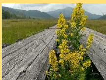
ミヤマアキノキンリンソウ