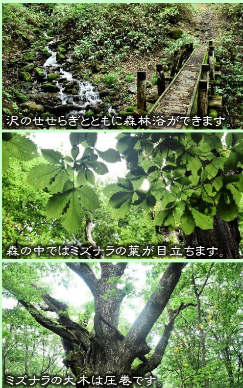
沢のせせらぎとともに森林浴ができます。