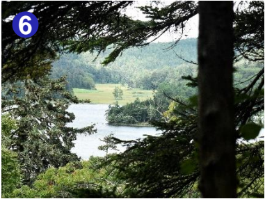
6 木々の間から尾瀬沼と大江湿原が見えます。夏に比べ、湿原の色は少しずつ変化しています。