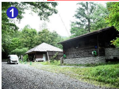
1 一ノ瀬では公衆トイレ、無人休憩所、自動販売機(清涼飲料水・軽食)がご利用できます。