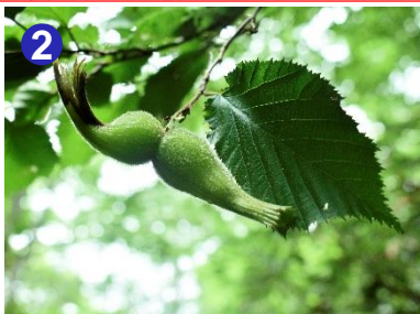
2 ヘーゼルナッツに近い仲間のツノハシバミの実が見られました。