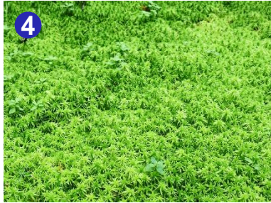
4 三平峠では鮮やかな苔の絨毯が見られる箇所があります。