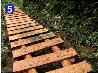
5 木道の再整備工事が始まっています。足元にお気をつけてご通行ください。