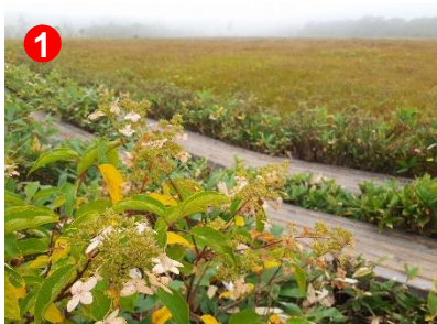
ノリツギの葉が黄色く色づいています。