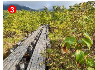
東電下の大堀橋付近の木々も、緑から黄色に変わってきました。