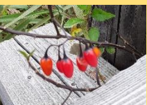
オオマルバノホロシ(実)