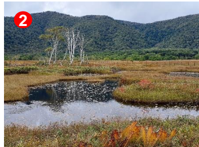
池塘に映りこんだ木々の色づきもきれいです。