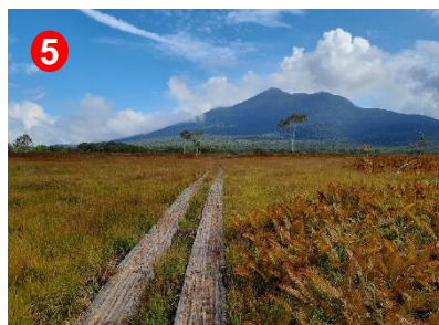
竜宮沼尻川橋を渡ると草紅葉の向こうに燧ヶ岳が望めます。