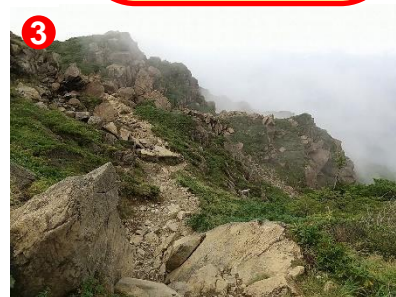
3 至仏～小至仏間は岩稜帯です。滑りやすい蛇紋岩に注意してください