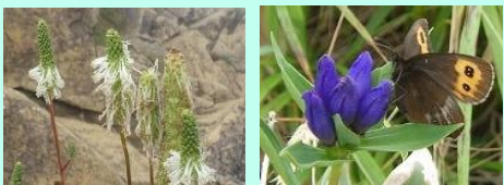
タカネウウチソウ