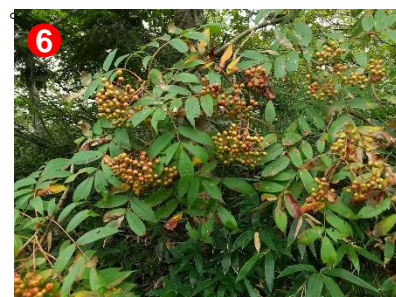
6 ナナカマドの実がオレンジに色づき始めていました。