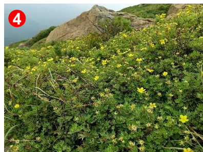
4 キンロバイが登山道脇の斜面で群生していました。