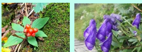
ゴゼンタチバナ(実)