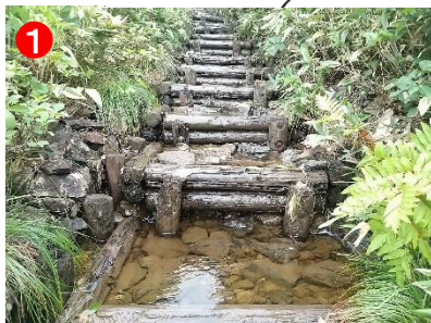
1 悪天候時は特に足元が悪くなります。ご注意ください。