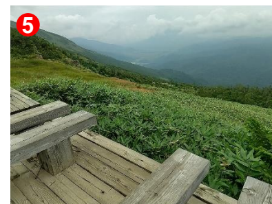
5 原見岩付近のベンチから尾瀬ヶ原を臨むことができます。