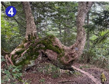
4 大きく湾曲したダケカンバの巨木です。雪深い環境の影響を受けて不思議な形をしています。