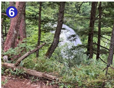
6 三条ノ滝の展望台は閉鎖されていますが、手前の第2テラスまでは通行可能です。