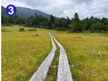
3 上田代にはベンチもあり燧ヶ岳、平ヶ岳、大杉岳、越後の山々を望めます。