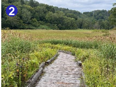
2 御池の駐車場から5分程の所に御池田代があり、桃色のオニシオガマが咲き始めました。