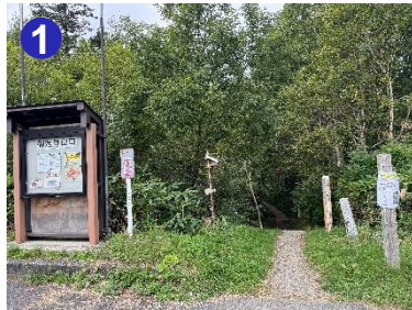
1 駐車場の奥に登山口があります。見晴までの間は水場がないので事前にご準備下さい。