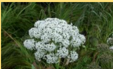
オオバセンキュウ