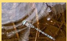
↑オス オオルリボシヤンマ