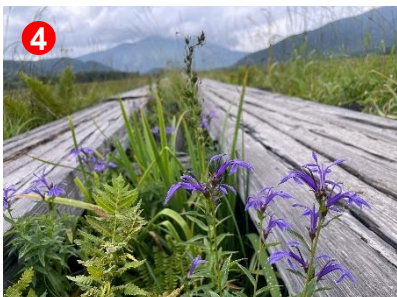
サワギキョウの花はそろそろ終わりを迎えています。