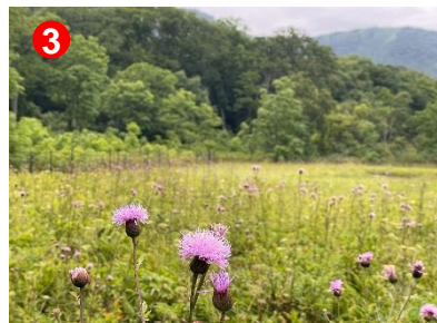
東電下の大堀川橋付近のシカ柵内にタムラソウが群生していました。