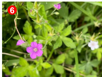
ゲンショウコのピンクと白の花が一緒にたくさん咲いていました。