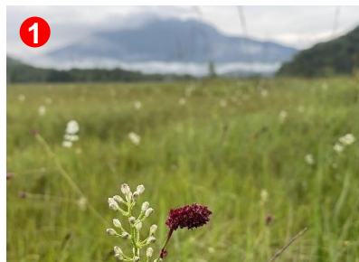
尾瀬ヶ原では、至る所でイワショウブの白い花を見ることができます。