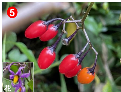
オオマルバノホロシの実(約1~2cm)が真っ赤に色づいていました。