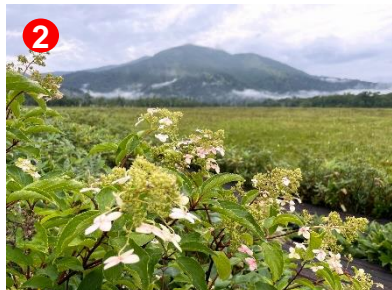
上の大堀川橋手前のベンチから見たノリウツギと至仏山です。