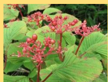
ケナシヤブデマリ(実)