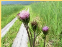
オゼヌママアザミ